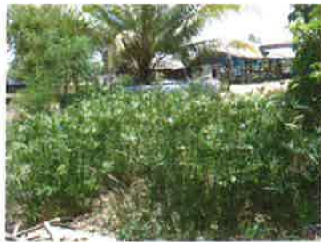
ต้นกกหรือต้นไหล