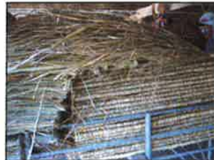
ขั้นตอนที่ 5