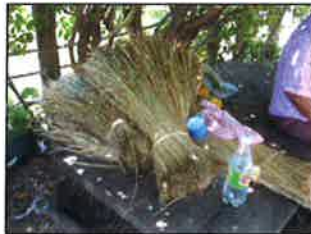
ขั้นตอนที่ 1-2