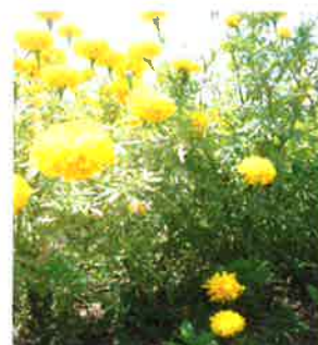
ผลผลิตดอกดาวเรืองที่ได้