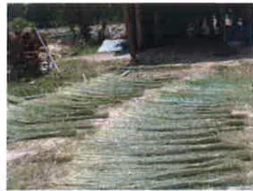
การตากต้นกกที่ผ่าเสร็จแล้วให้แห้ง