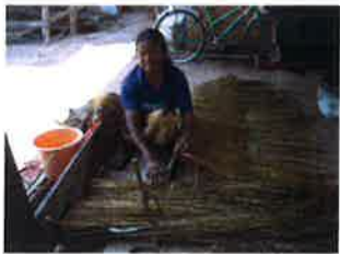
ขั้นตอนที่ 4