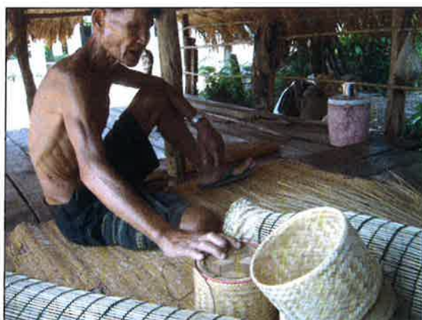
กระจิบใส่ข้าว