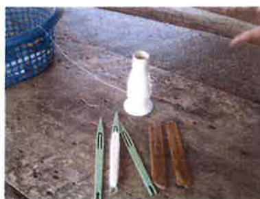
รูปภาพฉนวนถักแห