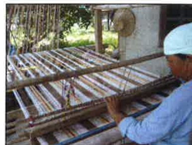
ขั้นตอนการทอผ้า