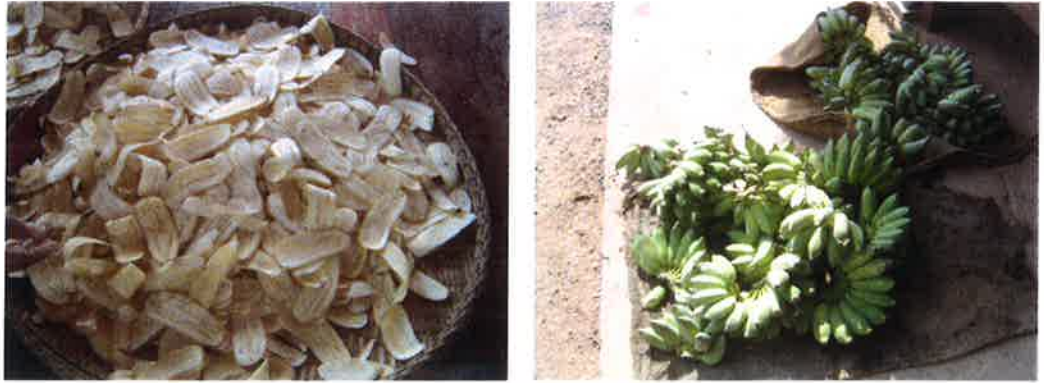
วัตถุดิบเบื้องต้น