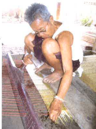
ขั้นตอนการทำในข้อ 3-5