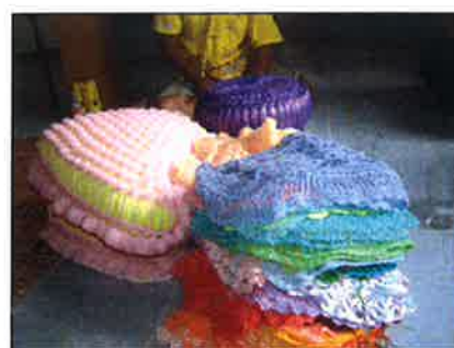
หมอนโนแบบต่างๆ