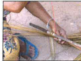
ขั้นตอนที่ 3