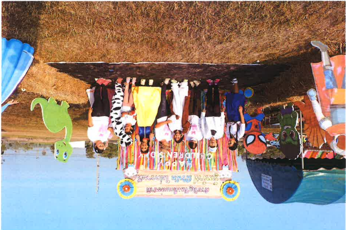
(๕) Happy Family การส่งเสริมสถานครอบครัวที่อบอุ่นและมั่นคง จิตศึกษาโรงเรียนโพธิ์ตาก อ.เมือง จ.พิจิตร ความสำคัญของครอบครัว - ภาพกิจกรรมที่พนักงานเจ้าหน้าที่ในองค์กร นำบุตรหลานเข้าร่วมกิจกรรมที่เทศบาลจัดขึ้น - วัฒนธรรม - วัฒนธรรม - วัฒนธรรม