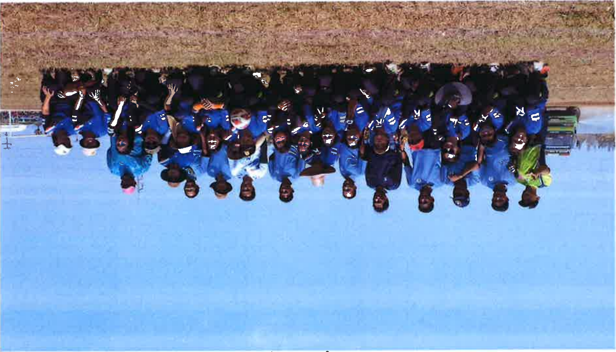
โครงการสร้างความรู้ความเข้าใจในการทํางาน ของสํานักงานเขตสุขภาพของประเทศไทย ๑) Happy Body การส่งเสริมสุขภาพกายและใจ จิตศึกษาสุขภาพจิตส่งเสริมสุขภาพของบุคคลกร ให้แข็งแรงทั้ง กายและใจ - กิจกรรมส่งเสริมการออกกำลังกาย - ส่งเสริมการดูแลสุขภาพของพนักงานเขตสุขภาพของประเทศไทย/ชุมชน