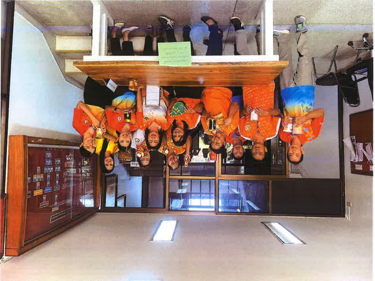
-การส่งเสริมสถานการณ์การออม ของในสำนักงานในส่วนงานแผนกสนับสนุนสำนักงาน