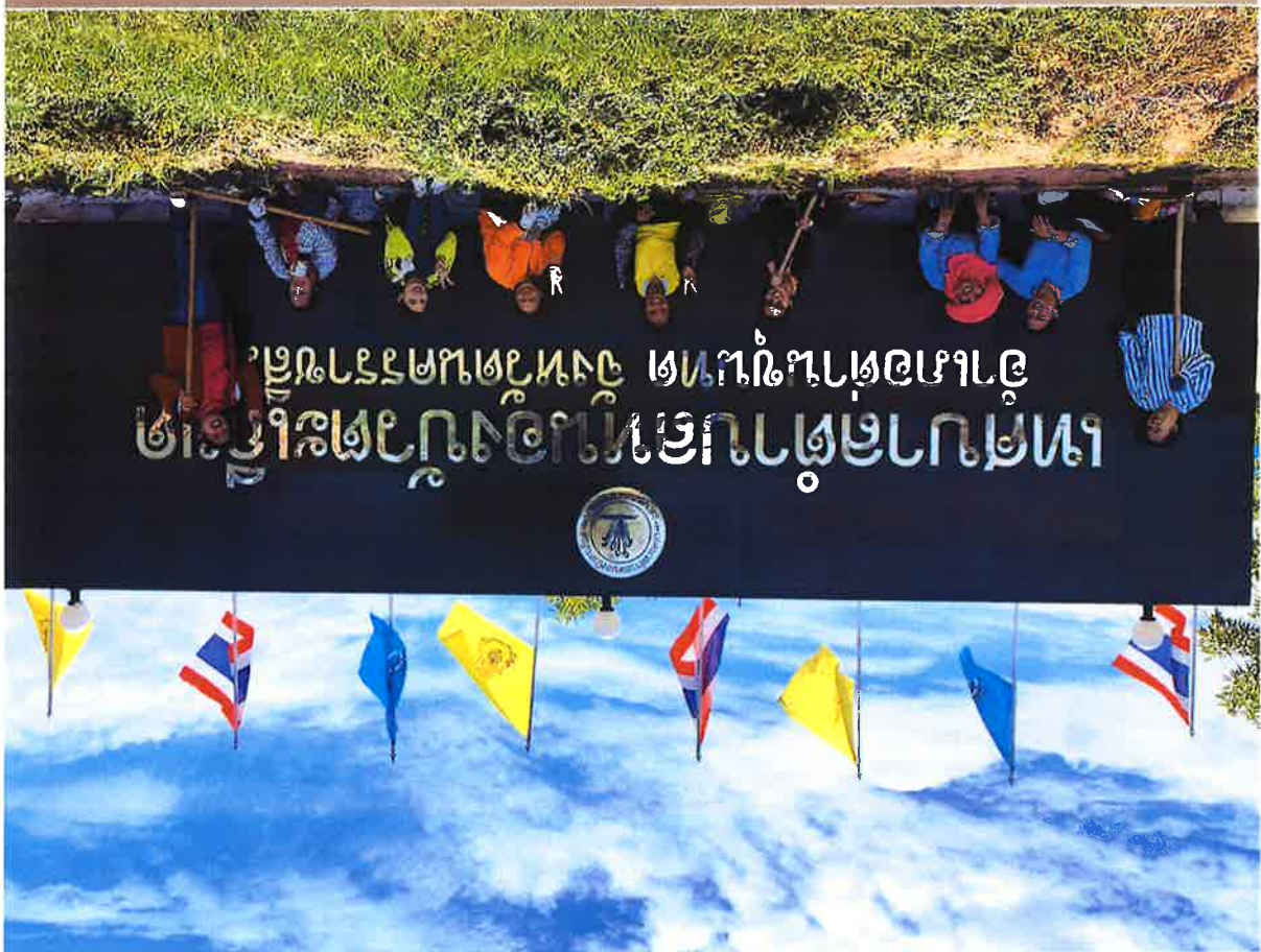
គ្លីនិកស្រូវសាលី