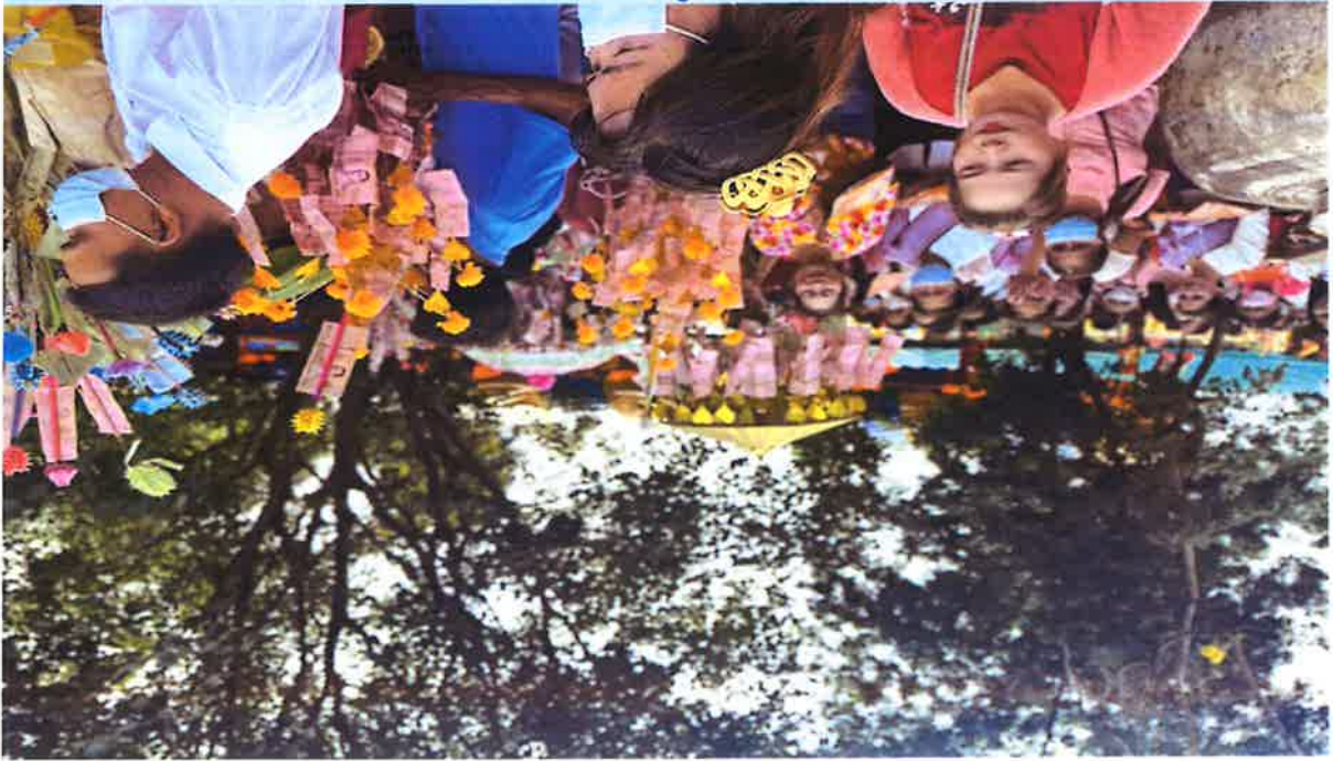
(๖) Happy Soul การส่งเสริมให้นักศึกษาร่วมใจกันทำกิจกรรมจิตอาสาพัฒนาสิ่งแวดล้อมในชุมชนและโรงเรียน - กิจกรรมจิตอาสาพัฒนาโรงเรียน - กิจกรรมจิตอาสาพัฒนาชุมชน - กิจกรรมจิตอาสาพัฒนาโรงเรียนและชุมชน - กิจกรรมจิตอาสาพัฒนาโรงเรียนและชุมชนและโรงเรียน