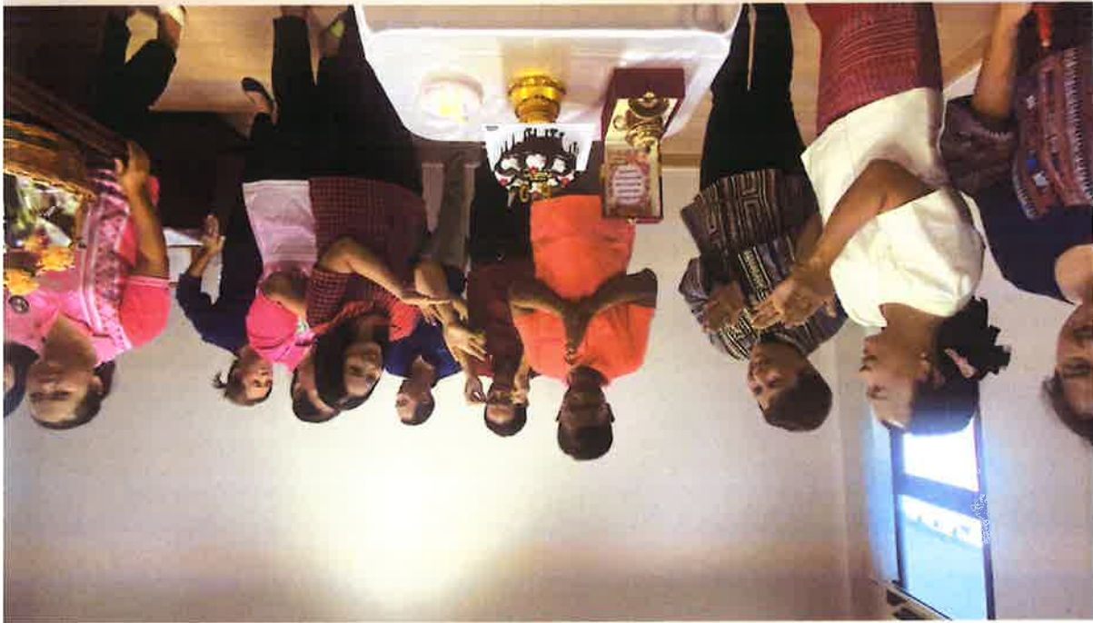
២) Happy Heart ការផ្សព្វផ្សាយស្តីអំពីការគ្រប់គ្រងសុខភាពស្រ្តី និងកុមារ ដោយមានការចូលរួមពីសមាជិកស្ថាប័នស្រ្តី និងកុមារ ក្នុងស្ថាប័នស្រ្តី និងកុមារ រដ្ឋបាលស្រុកស្រែចម្រើន ខេត្តកោះកុង រាជធានីភ្នំពេញ ។